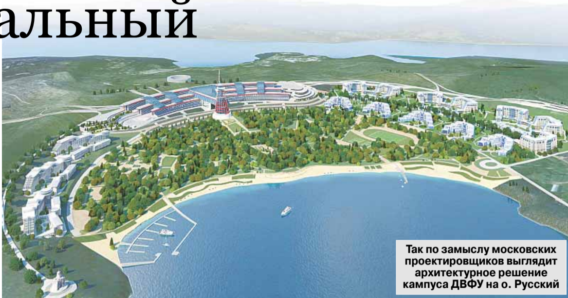
Так по замыслу московских проектировщиков выглядит архитектурное решение кампуса ДВФУ на о. Русский