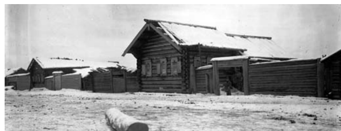
Нижнее Приангарье. Село Богучаны. Усадьбы с двумя дворами хозяйств средней зажиточности. 1911 г.

Можно было бы подумать, что староверы в своих постройках строго следовали образцам древнерусского зодчества. Однако это не совсем так. Они склонны были воспроизводить аскетичные архитектурные формы, хотя могли придавать им и большую пластическую выразительность, как это видим мы на Русском Севере. В данном случае, на Ангаре они соглашались на возведение храмов и по новым, классицистическим образцовым проектам, насаждавшимся Синодом. Впрочем, согласие их на то не требовалось. Империя вела свою унифицирующую конфессиональную политику, с которой приходилось считаться. Возможно, самые непримиримые поборники старой веры принимали решения о переходе на другие, более уединённые места, в