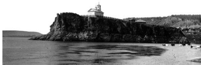
Деревня Каменка. Вид с р. Ангары. Фотография начала XX в. Богучанский краеведческий музей

Наверное, именно этой категории людей была во многом обязана своим обустройством и процветанием территория