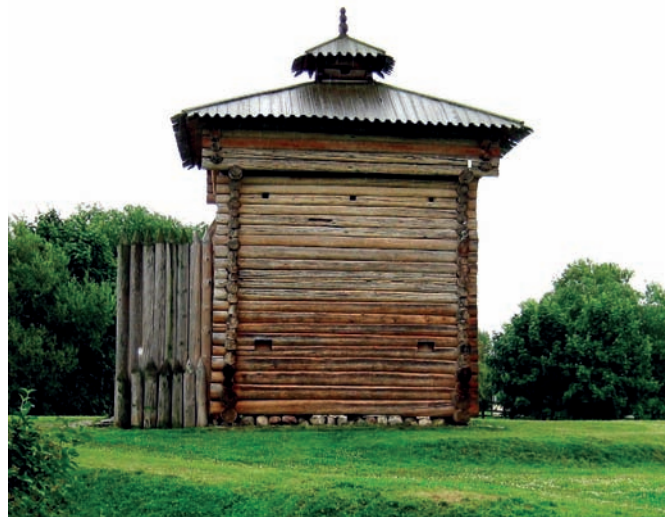
Башня Братского острога в Московском государственном объединённом художественном историко-архитектурном и природно-ландшафтном музее-заповеднике «Коломенское». 2017 г.

Создавались поселения с довольно правильной планировкой и рядовой застройкой. Но встречались и такие деревни,