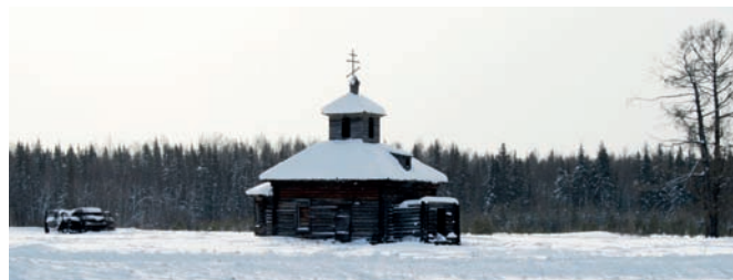
Деревня Юрокта Кежемского района. Церковь XIX в. 2014 г.

Леонардо да Винчи в своё время высказал глубочайшую мысль: «Великая любовь порождается великим знанием».