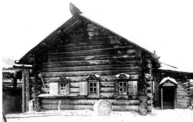
Село Богучанское. Уличный фасад жилого дома. 1911 г.