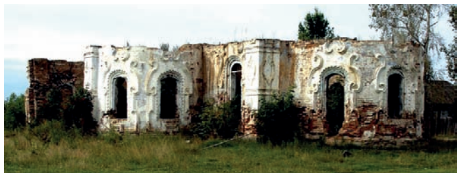
Спасская церковь перед затоплением села Кежда. Фотография 2009 г.

Начавшаяся «перестройка», казалось, положит конец подобного рода хищническому природопользованию. Тогда на высшем уровне было решено отказаться от проектов